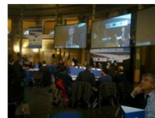
Il Forum MARLISCO a Roma